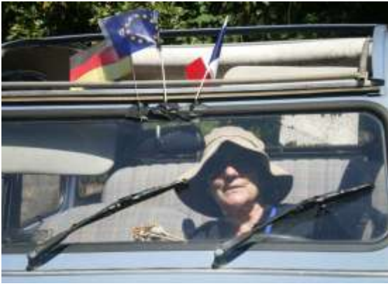
La 2cv avec les drapeaux