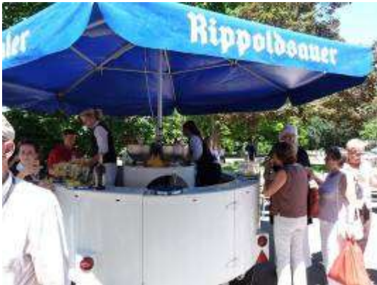
Un des points d'accueil

Il fait très chaud, le pot de bienvenue nous est servi devant le lycée où ont été installés de nombreuses tables, des parasols etc. ainsi qu'un podium sur lequel évoluent des chorales, des musiciens, pendant que des serveurs et serveuses très stylés nous servent des boissons « à volonté », sans oublier les traditionnels Bretzels ; le vrai bonheur !