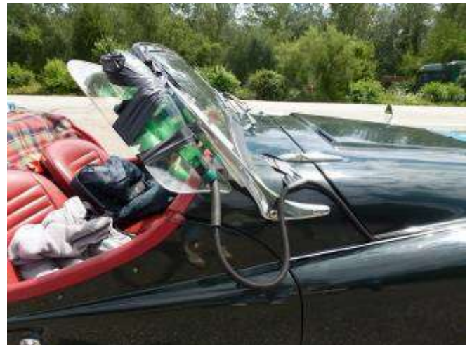
La perfusion de Pascale