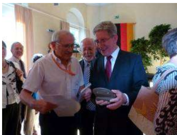
La remise du Trophée

Normalement, cette cérémonie marquait la fin de l'anniversaire pour tous ceux qui repartaient à Dole après les adieux entre les participants des 2 villes, sachant que nous étions la seule association à passer une 2eme nuit à Lahr (il n'était pas envisageable de reprendre la route pour 300 km après une journée aussi chargée).