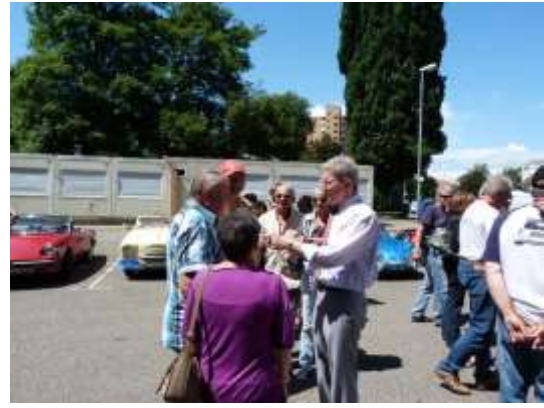
Mr le Maire de Lahr nous accueille

Nous nous retrouvons maintenant avec tous les autres Dolois (environ 200) qui font partie de la délégation (marcheurs, cyclistes, orchestres, danseurs, membres du Comité de Jumelage et autorités) qui sont, pour beaucoup, venus en bus, mis à part les sportifs (à pied ou en vélo).