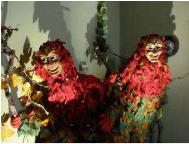
Exemple de costume