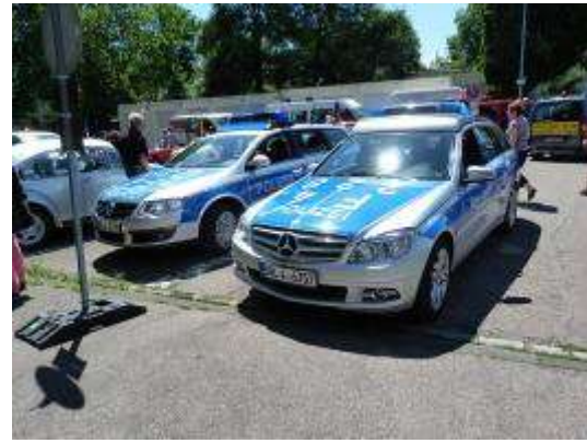
Le service d'ordre

La collation étant prévue à l'intérieur du Lycée, on nous demande, en Français, de bien vouloir nous y rendre. De nombreuses rangées de tables ont été installées dans un grand hall ; les couverts étant déjà installés. Il ne nous reste plus qu'à aller chercher un peu de nourriture et une boisson. Et là, c'est encore une grande surprise ; en fait de collation, plusieurs buffets sont installés et nous avons le choix entre de nombreux plats chauds qui n'ont rien à envier à ceux que l'on trouve dans nos restaurants Français : par exemple, des tranches de rôti avec une garniture de champignons arrosés d'une sauce au vin succulente, toujours servi par un personnel très aimable. Il en sera de même pour les desserts. Quant à la boisson, une table est recouverte d'environ 1 m 2 de bouteilles diverses qui nous tendent les bras. J'ai oublié une chose importante : tout est à volonté !!! Des collations comme celle là, on en redemande !