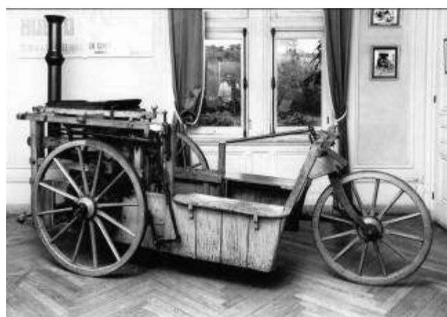
Musée de la Rochetaillée

Le véhicule était une sorte de break à trois roues, en bois cerclées de fer, avec une direction à barre franche, communément appelée « queue de vache ».